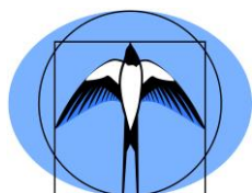
KURATORIUM OŚWIATY W KRAKOWIE